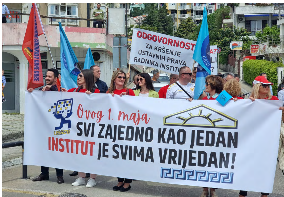
Sa protesta podrške radnicima Instituta u Igalu

Unija slobodnih sindikata Crne Gore organizovala je Prvomajsku protestnu šetnju u Igalu kao podršku zaposlenima u Institutu "Dr Simo Milošević" koji već četvrti mjesec ne primaju platu, pa im je egzistencija dovedena u pitanje. Sa protestnog skupa Vladi je upućen apel da hitno zaustavi dalje urušavanje ove renomirane zdravstvene ustanove čiji su računi u blokadi duže vrijeme, što dovodi u pitanje njen opstanak. Institut se bavi zdravstvenim turizmom i rehabilitacijom više od 70 godina i u njemu borave pacijenti iz mnogih evropskih zemalja. Istovremeno, posjeduje dragocjene prirodne resurse a u njegovom vlasništvu je i Vila "Galeb", poznatija kao Titova vila, koja predstavlja posebnu turističku atrakciju za posjetioce iz cijelog svijeta. Konačno, Institut je nastavna jedinica Univerziteta Crne Gore, jer se kompletna praktična ali i teorijska nastava na Fakultetu primijenjene fizioterapije obavlja u Igalu.