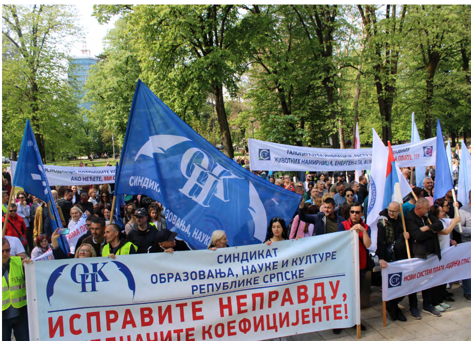
Sa jednog od protesta Saveza sindikata RS

P ravo na štrajk radnicima u Republici Srpskoj garantovano je Ustavom a ostvaruju ga u skladu sa zakonom koji je u RS donesen 2008., a dopunjen 2020. godine. Štrajk, kao najradikalniji vid sindikalne borbe radnika za svoja prava ima nekoliko bitnih elemenata, a to su: prekid rada, zaštita zajedničkih prava i interesa radnika i namjera da se poslodavcu nanese materijalna šteta koja će biti opomena i za druge poslodavce da ne rade na štetu radnika.