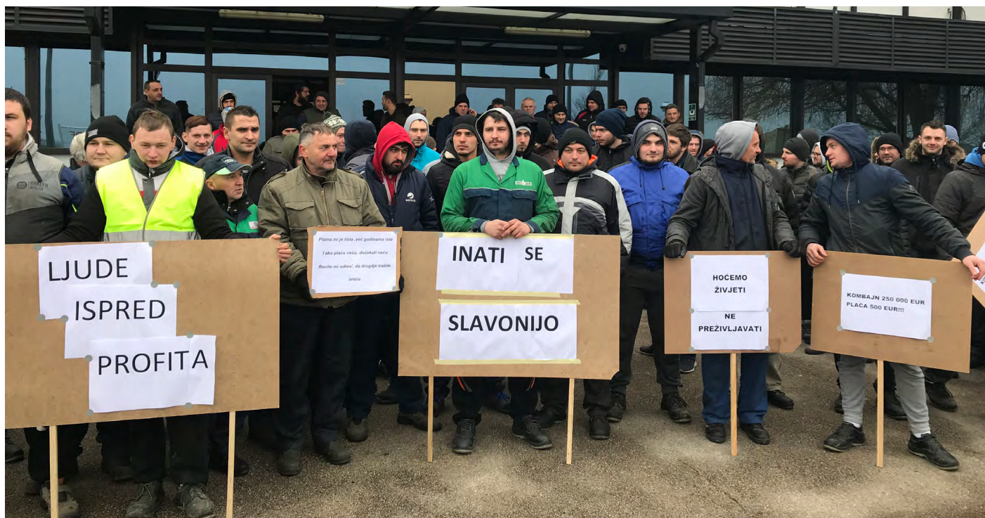
Radnici tvornice kombajna Same Deutz Fahr u štrajku za povećanje plaća 2019.