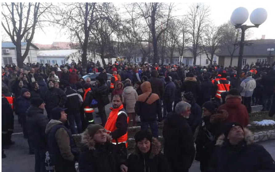
Primer dobre organizacije štrajka u kompaniji Zidín

Delatnost od javnog interesa, u skladu sa Zakonom o štrajku, jeste delatnost koju poslodavac obavlja u elektroprivredi, vodoprivredi, saobraćaju, informisanju (radio i televizija), PTT uslugama, komunalnim delatnostima, proizvodnji osnovnih prehrambenih proizvoda, zdravstvenoj i veterinarskoj zaštiti, prosveti, društvenoj brizi o deci i socijalnoj zaštiti.