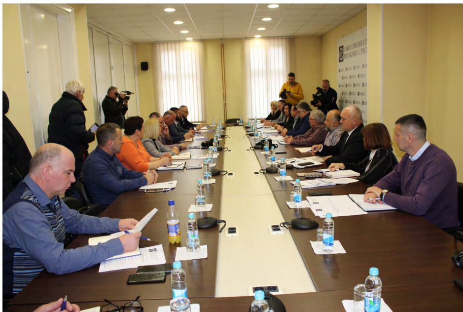
Novim sistemom plata zadržati radnike u RS

Uređenjem sistema plata u realnom sektoru došlo bi do zaključivanja Opšteg kolektivnog ugovora, kojim će se utvrditi najniži koeficijenti za obračun plata, po stručnim spremama predviđenim sistematizacijom poslova za svako radno mjesto. Time ne bi bilo ograničeno kolektivno pregovaranje na nivou privrednih grana i unutar preduzeća. Elementi za utvrđivanje osnovne plate bili bi najniži koeficijenti složenosti poslova koji se množe sa najnižom platom u RS a koja trenutno iznosi 700 konvertibilnih maraka.