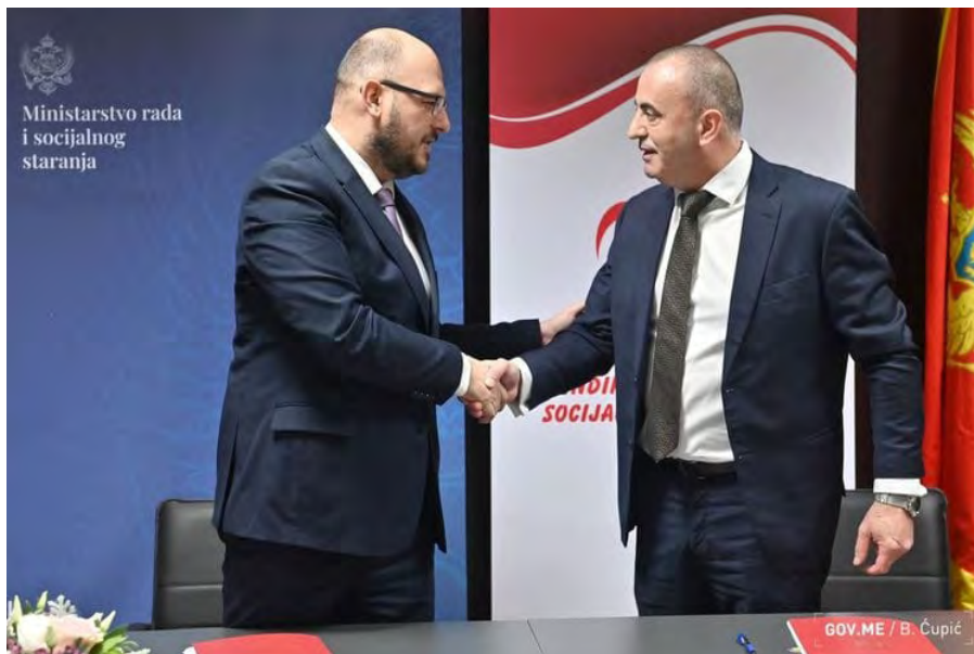
Sa potpisivanja GKU za socijalnu djelatnost

Najznačajniji je GKU koji su potpisali Sindikat uprave i pravosuđa i Ministarstvo finansija a kojim su povećane plate za oko 20 hiljada zaposlenih u javnoj upravi i pravosuđu za 20% u ovoj godini. Ugovorom je predviđeno i dodatno uvećanje zarada 2024. i 2025. godine, od najmanje 10%. Takođe, potpisan je i novi GKU za zaposlene u socijalnoj djelatnosti, pa su i njima plate povećane za 20%. Još jedan Granski ugovor potpisali su i reprezentativni sindikati Uprave policije sa ministrom finansija Aleksandrom Damjanovićem kojim su, nakon dugo vremena, povećane zarade i policijskim službenicima.