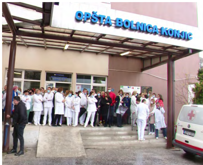
Štrajk zaposlenih u bolnici u Konjicu

Posljednjih godina najveći broj štrajkova organizovan je u javnom sektoru i kompanijama koje su većinski u državnom vlasništvu. Razlozi su, prije svega, u većoj sindikalnoj organizovanosti radnika u tim sektorima, činjenici da ti