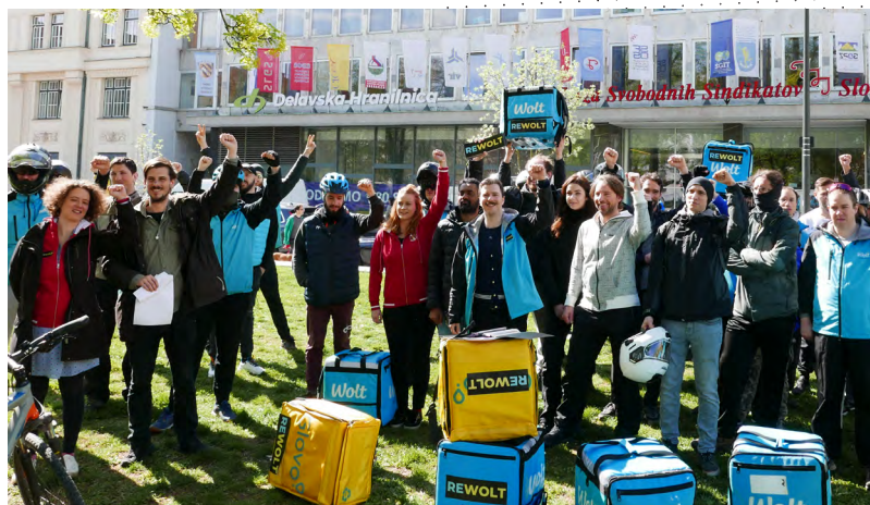
Dostavljačice i dostavljači svih platformi, ujedinito se!

U Sloveniji je 1. maja 2023. godine stupio na snagu novi, nedavno usvojeni pravilnik o profesionalnim bolestima, na koji radnici čekaju neverovatnih i neprihvatljivih trideset godina. Sve ovo vreme u ZSSS-u smo na različite načine – od raznih apela, protesta do prijave Republike Slovenije Međunarodnoj organizaciji rada (MOR) – radili na donošenju ovog tipa relevantnog pravilnika, a sada je konačno napravljen važan i za slovenačku situaciju ogroman korak napred. Profesionalno oboleli radnici konačno će moći da ostvare svoja prava.