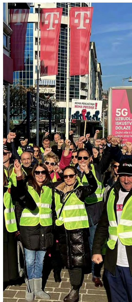
Dugo trajao ali uspio - detalj sa štrajka Crnogorskog Telekomu

Zakonom o štrajku navedene su djelatnosti od javnog interesa gdje bi prekid rada zbog prirode posla mogao da ugrozi život i zdravlje ljudi ili opšti interes građana, pa u njima štrajk može početi ako se prethodno utvrdi minimum procesa rada. To sporazumno utvrđuju nadležni organ državne uprave, reprezentativnog udruženja poslodavaca i reprezentativnog sindikata. Ovdje je važno napomenuti ulogu Agencije za mirno rješavanje radnih sporova koja je nezaobilazan faktor u situaciji kada subjekti u sporu ne postignu saglasnost o minimumu procesa rada.