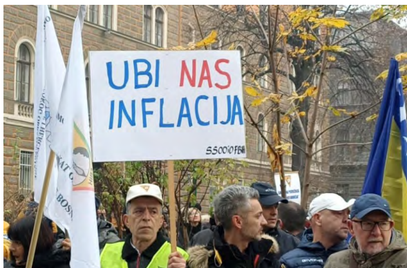
Sa jednog od protesta SSS BiH

sindikati imaju na raspolaganju više novca kao i zbog toga što tu nije riječ o privatnim poslodavcima. Naime, u industrijskom sektoru imamo veći broj privatnih vlasnika kompanija koji često zabranjuju organizovanje sindikata ili sami organizuju svoje žute sindikate kojima onda upravljaju. Takođe, tu se suočavamo i sa velikom dozom straha radnika od gubitka posla i velikim brojem ugovora o radu na određeno vrijeme što olakšava tim poslodavcima da radnicima uruče otkaze ako izraze svoje nezadovoljstvo ili pokrenu inicijativu za štrajk.