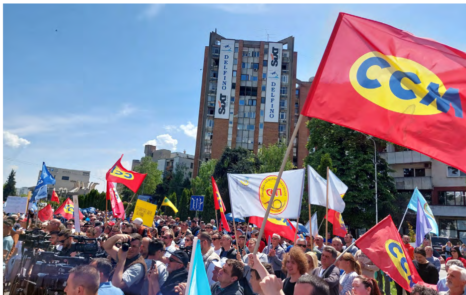
„Radnici su država“: Sa prvomajskog protesta u Skoplju

„Radnici su država“, bio je slogan masovnog radničkog protesta koji je 1. maja organizovao Savez sindikata Makedonije