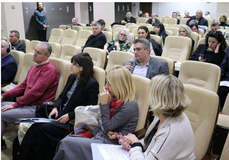
Конференција на КСС за Законот за безбедност и здравје при работа

Едукативни конференции и други информативни настани на вакви значајни теми организираат и гранските синдикати здружени во КСС, бидејќи се свесни дека мал број работници ги знаат своите права и дека континуираната едукација е едно од најефикасните оружја во синдикалната борба за подобрување и унапредување на работата, како и подобрување на економска и социјална положба на членството.