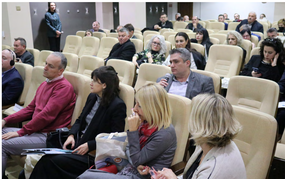
Konferencija KSS o Zakonu o bezbednosti i zdravlju na radu

K onfederacija slobodnih sindikata Makedonije (KSS) kontinuirano obrazuje svoje članove, posebno za najvažnije aktivnosti kao što su sindikalno udruživanje, kolektivno pregovaranje i bezbednost i zdravlje na radu.