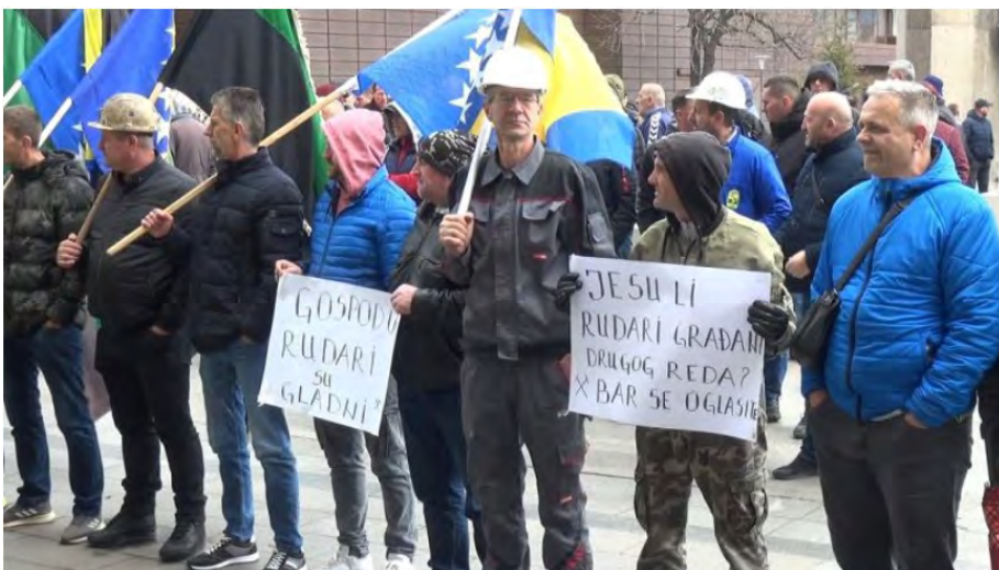
Štrajk rudara u Zenici

Zakon o štrajku Federacije Bosne i Hercegovine kojim je ovo pitanje regulisano u FBiH donesen je davne 2000. godine i sa svojih samo 16 članova predstavlja veliku prepreku za organizovanje legalnog štrajka. Naime, njime mnoga pitanja nisu adekvatno ili nisu uopće riješena, što otežava samo organizovanje i vođenje štrajka. Zbog toga je do sada bilo puno slučajeva u kojima su štrajkovi proglašavani nezakonitim ili su sindikati bili primorani da odustanu od njih, iako su postojali razlozi.