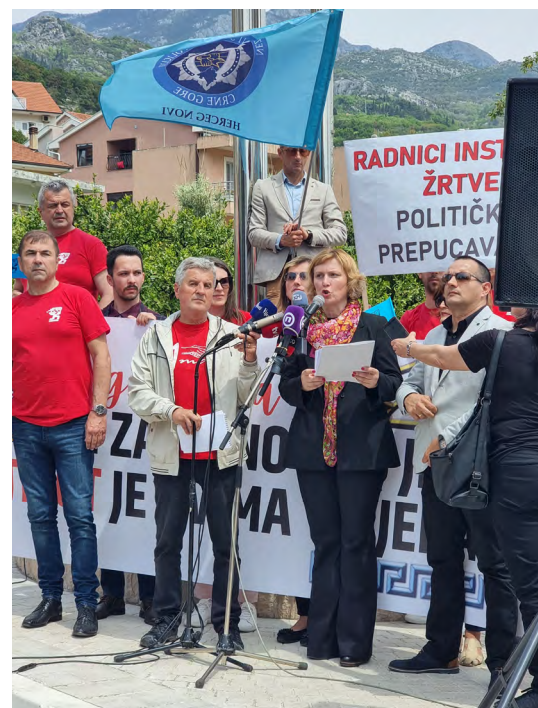
Na protestu poručeno da je Institut dragulj Crne Gore

SEDMICA SOLIDARNOSTI SA RADNICIMA INSTITUTA IGALO