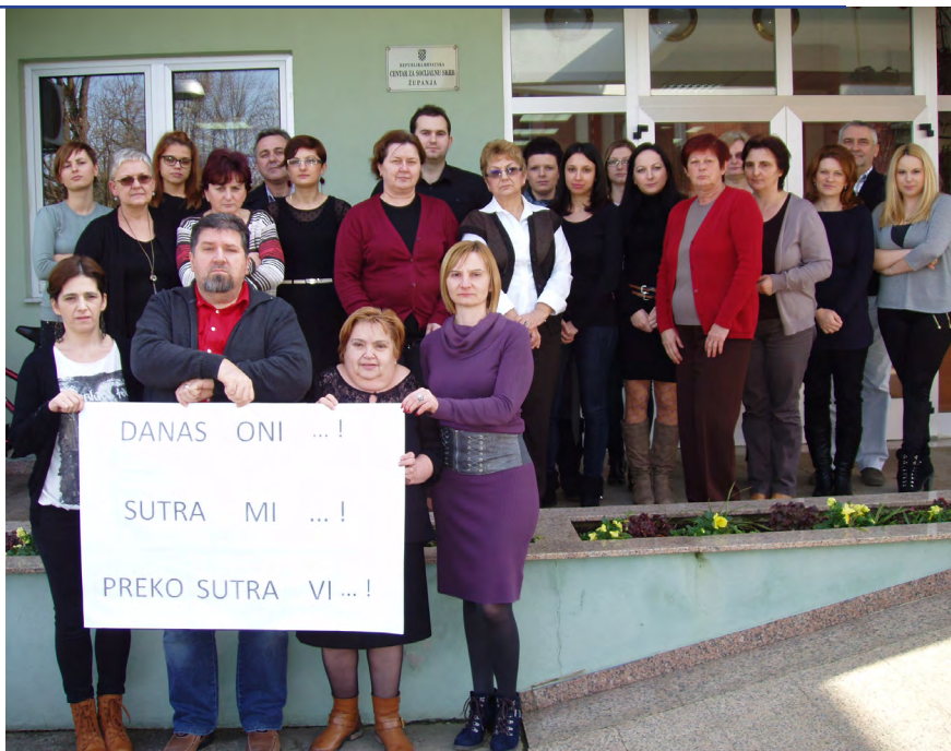
Generalni štrajk 2014. u formi štrajka solidarnosti

Prema ustavnoj odredbi, u oružanim snagama, redarstvu, državnoj upravi i javnim službama može se ograničiti pravo na štrajk, te se ono u tim sektorima uređuje posebnim zakonima. Djelatnim vojnim osobama nije dopušten štrajk, a za službenike i namještenike u oružanim snagama, kao i policijske službenike, definirane su okolnosti u kojima štrajk nije dopušten (npr. u ratnom stanju ili u slučaju proglašenja elementarne nepogode). Također, policijskim službenicima propisana je dužnost primjene policijskih ovlasti i za vrijeme sudjelovanja u štrajku, ako je to nužno zbog zaštite života i sigurnosti ljudi ili procesuiranja kaznenih djela. U javnim službama, pravo na štrajk ograničeno je samo u sustavu hitne medicine.