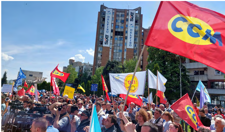
Работниците се државата: Од првوماјскиот протест во Скопје

работници“, како што гласеше слоганот на првوماјскиот протест. Пораката на собирот беше работничкиот глас да не се слуша само со славење на празниците, бидејќи борбата ќе продолжи. Првوماјскиот протест е почеток на синдикалната пролет и затоа е неопходно единство во борбата за работничките права бидејќи луѓето масовно ја напуштаат државата.