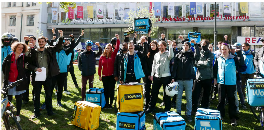
Dostavljačice i dostavljači svih platformi, ujedinito se!

V Sloveniji je 1. maja 2023 l. stopil v veljavo nov, nedavno sprejet pravilnik o poklicnih boleznih, na katerega so delavci čakali neverjetnih in nesprejemljivih trideset let. Ves ta čas smo si v ZSSS na različne načine – od različnih pozivov, protestov do prijave Republike Slovenije Mednarodni organizaciji za delo (MOR) – prizadevali za sprejetje tovrstnega ustreznega pravilnika, sedaj pa je končno storjen pomemben in za slovenske razmere ogromen korak naprej. Delavci s poklicnimi boleznimi bodo naposled lahko uveljavili svoje pravice.